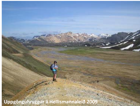
Uppgönguhryggur á Hellismannaleið 2009