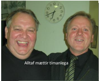
Alltaf mættir tímanlega